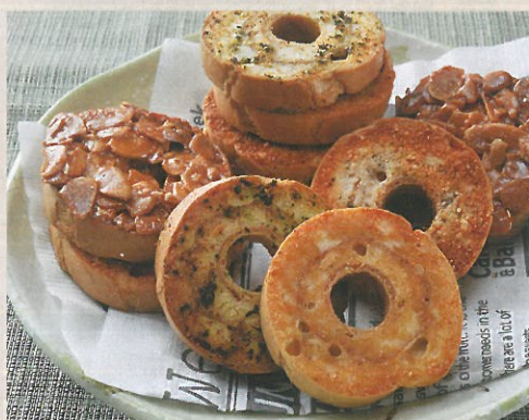
伝統の技で作られる車麩がおしゃれな洋菓子に变身。きめが細かい車麩の特徴を生かした食感が楽しめます

ドーナツ状の丸い形をした「車麩」は、新潟県三条市の名産品。この車麩をお菓子に仕上げたのが「車麩ラスク」です。