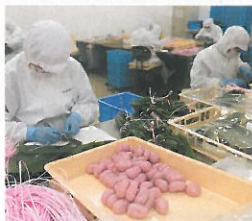
団子を笹で巻いていく作業。安心・安全な商品を届けるために徹底した品質管理を行っています