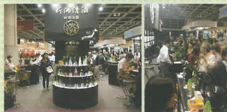
新潟県酒造組合が出展した「香港ワイン&スピリッツフェア2013」の様子

今回の「今宵の酒・肴」でご紹介した「朝日山」をはじめ、海外でも高い評価を受ける県産日本酒は多く、今後も日本酒人気の拡大が期待されます。